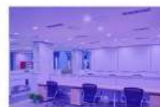
Chiếu sáng VPCS