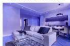
Chiếu sáng dân dụng