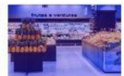
Chiếu sáng thương mại