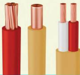
DÂY DẪN DỤNG KHÔNG CHỈ LF & LSHF