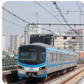
Dự án Metro Bến Thành - Suối Tiên