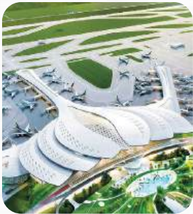
Dự án Sân bay quốc tế Long Thành

Với vai trò là nhà sản xuất dây cáp điện hàng đầu, CADIVI đã đồng hành cùng hàng loạt công trình trọng điểm trên khắp cả nước. Từ lưới điện quốc gia, các khu công nghiệp lớn đến những dự án hạ tầng và công trình biểu tượng, sản phẩm của CADIVI luôn âm thầm trong việc truyền tải nguồn năng lượng bền bỉ. Mỗi công trình có sự góp mặt của CADIVI là một minh chứng rõ nét cho chất lượng, uy tín và cam kết đồng hành cùng sự phát triển của đất nước.