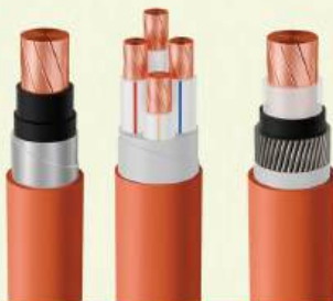
CÁP CHỐNG CHÁY & CÁP CHẬM CHÁY