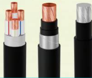
CÁP ĐIỆN LỰC HẠ THỂ