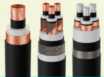
CÁP TRUNG THỂ CÓ MÀN CHẮN