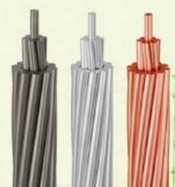
DÂY DẪN TRẦN

SẢN PHẨM CADIVI ĐẠT ĐƯỢC NHIỀU CHỨNG NHẬN CHẤT LƯỢNG UY TÍN