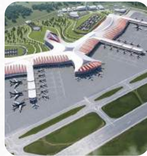
Dự án Cảng hàng không quốc tế Phú Quốc