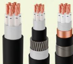
CÁP ĐIỀU KHIỂN