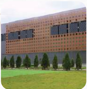
Dự án Trung tâm dữ liệu quốc gia